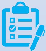
Планирование и (или) проведение